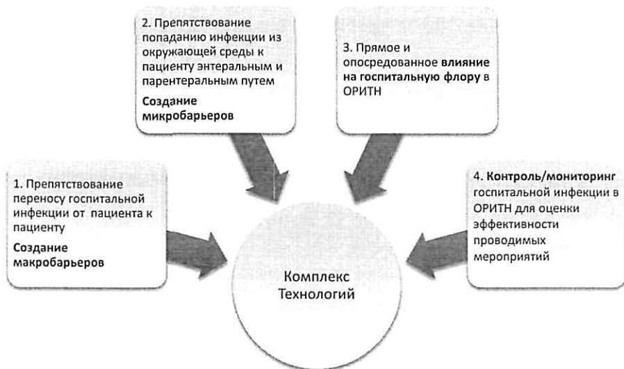
Рисунок. 1 Комплекс технологий системы профилактики госпитальной инфекции

Для успешного функционирования этой системы необходимо одновременное выполнение комплекса технологий: (рис.1)