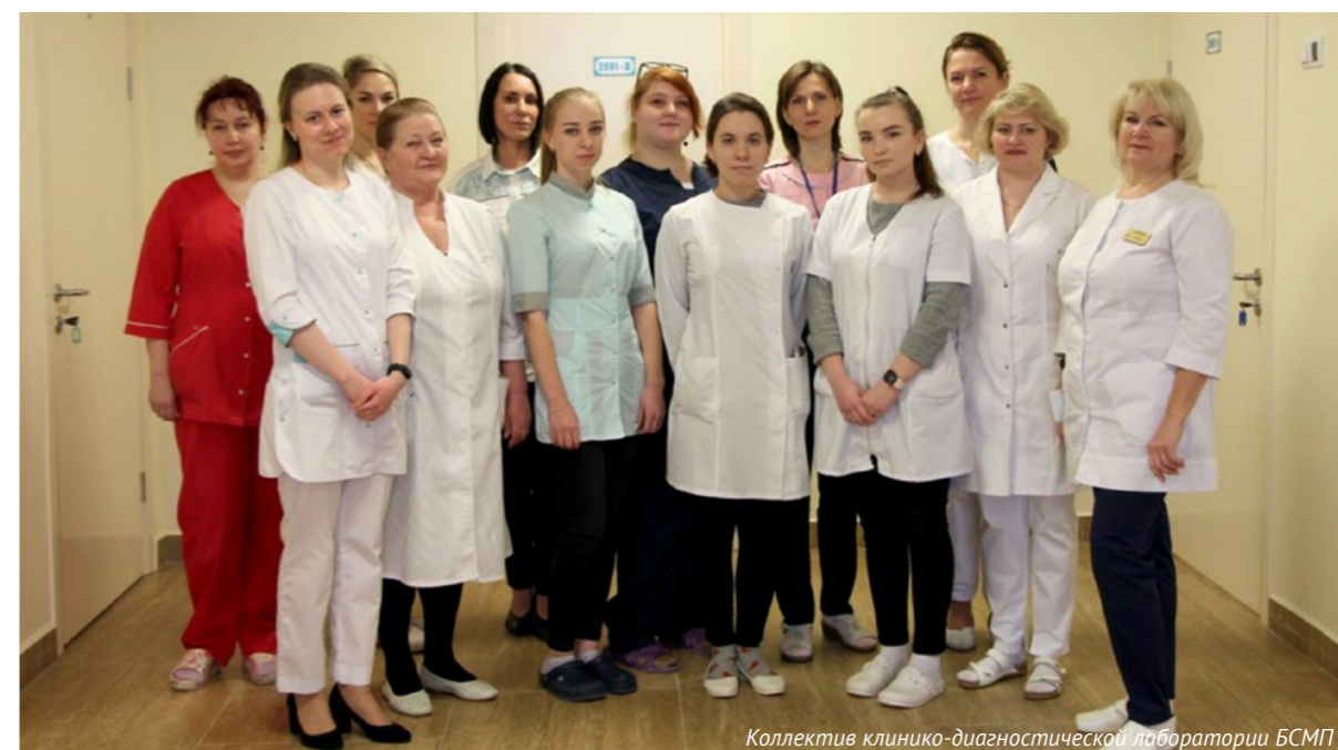
Коллектив клинично-диагностической лаборатории БСМП

Но, тем не менее, более 90% работы лаборатории сейчас – это анализы, связанные с COVID-19. У пациентов с коронавирусной инфекцией врачу необходимо следить за С-реактивным белком, коагулограммой, делать общий анализ крови. У тех, кто уже переболел, нужно уделять внимание показателям свертываемости крови, потому что они находятся длительное время на терапии антикоагулянтами, а также общему анализу крови, биохимическим показателям, поскольку у пациентов подчас остается ряд постковидных патологических состояний, которые нуждаются в коррекции. Безусловно, важно наблюдать за уровнем антител. Все это исследуется в лаборатории БСМП.