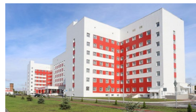
В 2020 году новая клиника начала свою работу. Вид нового здания Городской клинической больницы скорой медицинской помощи.