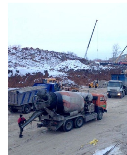
Закладка фундамента новой БСМП, январь 2017 года.