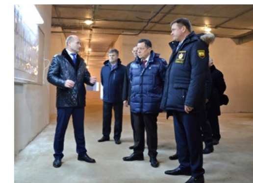
Губернатор Рязанской области Николай Любимов и депутат Госдумы Андрей Макаров инспектируют строительство новой БСМП. Ноябрь 2018 года.