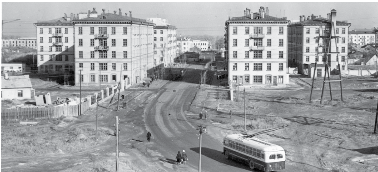
1955-1957 годы, Рязань, ул. Дзержинского. Справа – корпуса Больницы скорой медицинской помощи.

История Больницы скорой медицинской помощи начинается в 1954 году. Тогда она располагалась на улице Дзержинского и называлась «Городская больница № 2». Больница была небольшая – коечный фонд составлял всего 200 мест, а работали там всего четыре отделения: хирургическое, травматологическое, гинекологическое и терапевтическое.