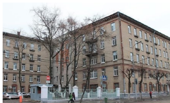
После переезда БСМП на ул. Стройкова, в корпусах на ул. Дзержинского временно разместился Онкологический диспансер. Современный вид этого исторического для рязанской медицины места.