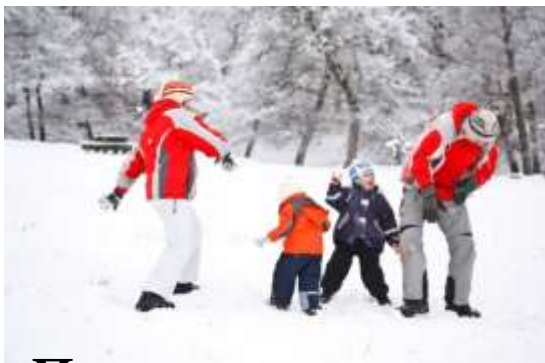
Прогулки на свежем воздухе